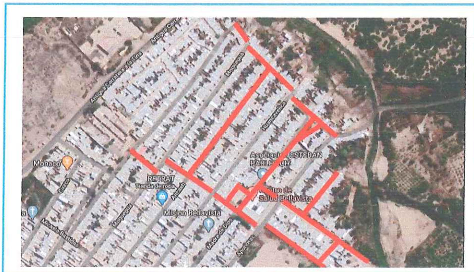
Gráfico 02: Localización del proyecto Elaboración propia