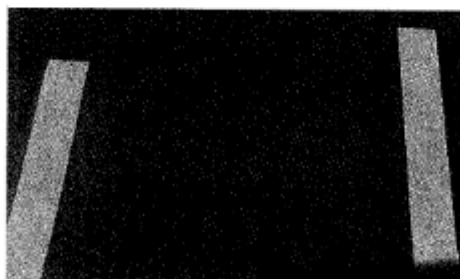
Figura 1 (No incluye diseño)