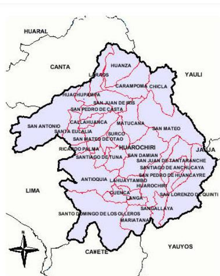
MAPA DE LA PROVINCIA DE HUARACHIRI