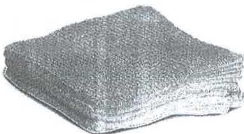
Fig. 1 (No incluye diseño)