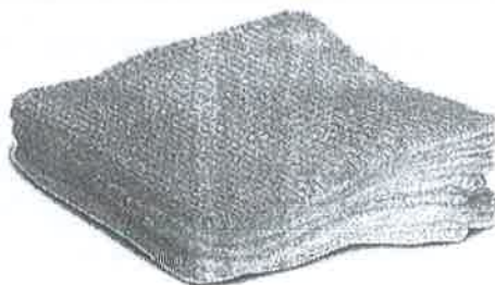
Fig. 1 (No incluye diseño)