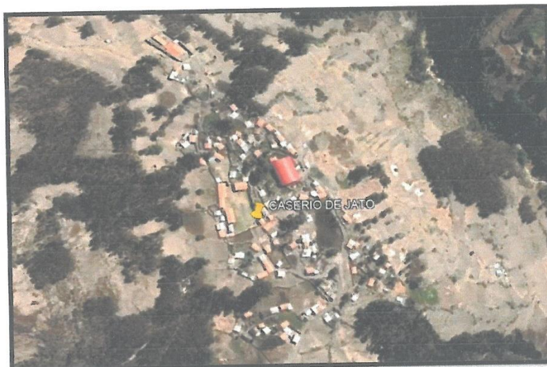
Grafica N°03 Micro localización del Proyecto