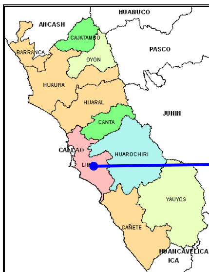
Mapa de Lima Metropolitana