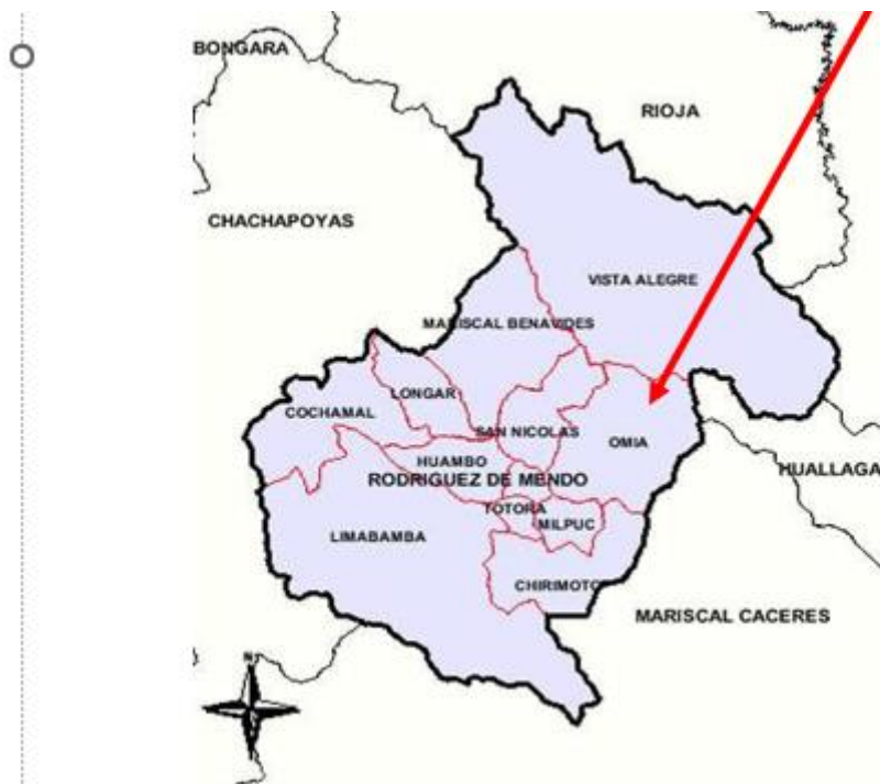
MAPA Nº 03: AREA DE INFLUENCIA DEL PROYECTO