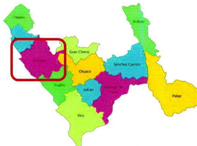
Figura N° 02: Ubicación de la provincia de Ascope.