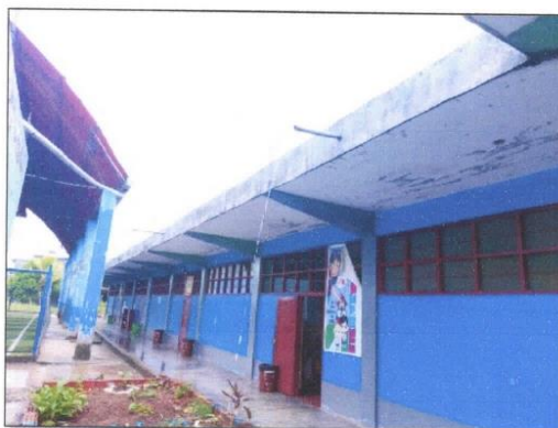
vista panorámica de la I.E. Villa Cariño

GERENCIA SUB REGIONAL DE INFRAESTRUCTURA Y TRANSPORTE