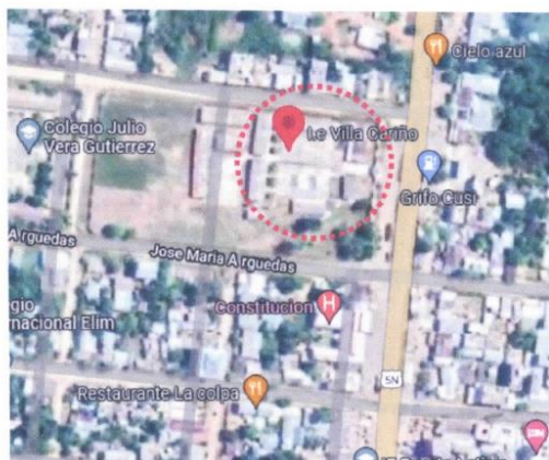
Imagen Satelital de la I.E. Villa Cariño