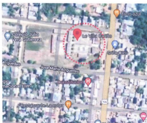
Imagen Satelital de la I.E. Villa Cariño