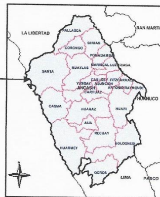
Provincia de Santa