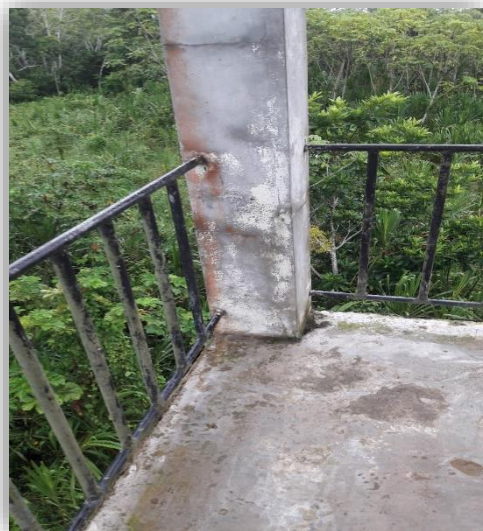
Fig. 07– Columna del tanque elevado existente

Columnas: se observa las siguientes patologías