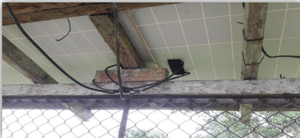
Fig. 05 – Estructura de madera de los paneles solares existente

El Panel solar, placa solar o modulo solar: se observa que sus instalaciones de los paneles fotovoltaicos presentan las siguientes dificultades.