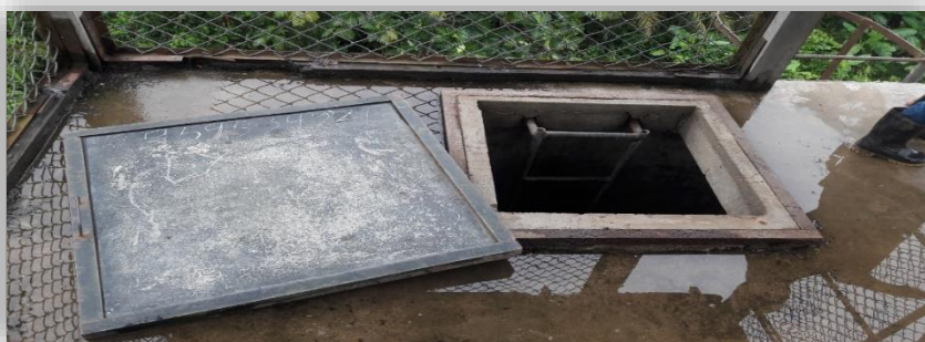
Fig. 06– Cobertura de la cuba existente

Techo de cuba: se observa diferentes tipos de patologías