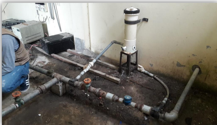
Fig. 09– Sistema de cloración existente