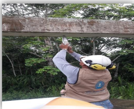
Fig. 08– Viga del tanque elevado existente