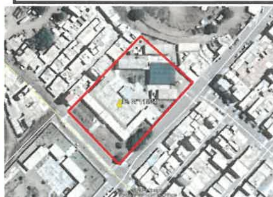
Imagen 01- Ubicación Geográfica de la Institución Educativa N° 11524