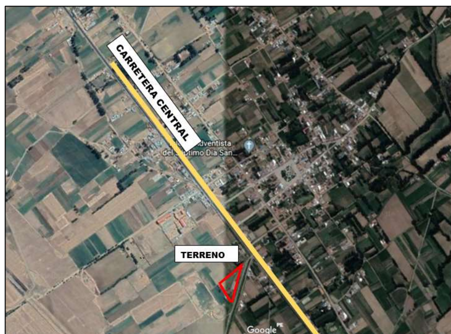
IMAGEN SATELITAL (GOOGLE EARTH)