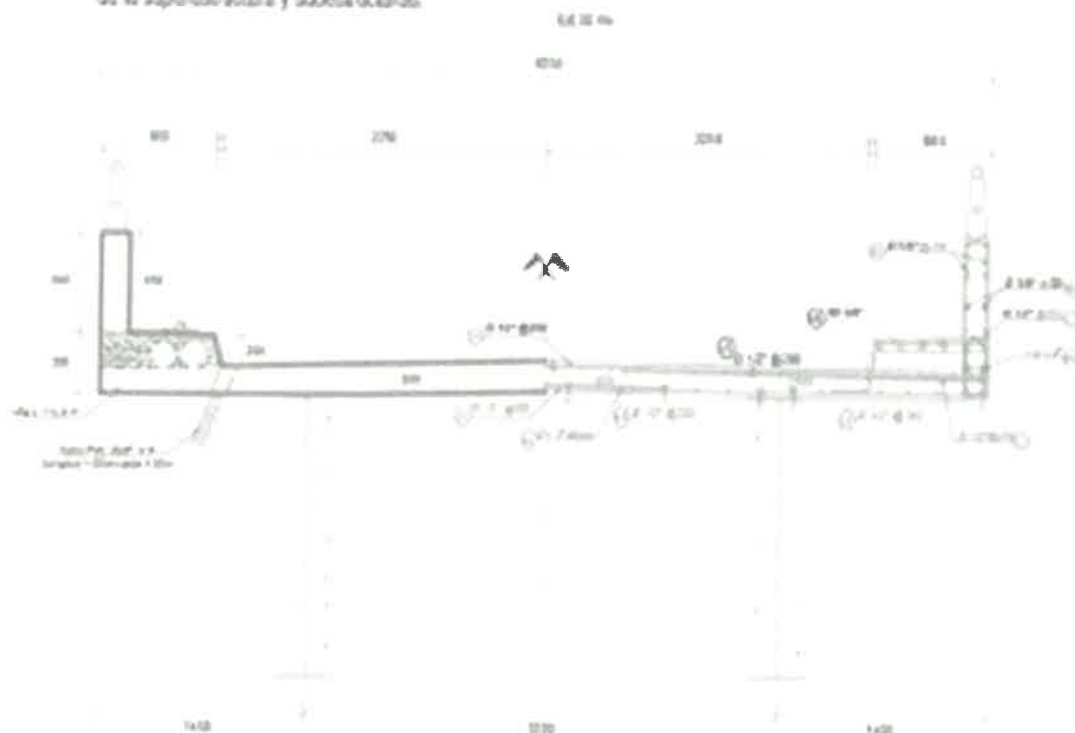
Fig. N° 1: Corte Superestructura

La carga viva vehicular de diseño corresponde a la carga HL-93 (Camión de 32.65 ton + ase carga repartida de 0.962 ton/m) del método moderno de diseño de puentes LRFD según el "Manual de Diseño de Puentes del MTC" y las normas americanas AASHTO. Se usará las especificaciones de diseño del método LRFD del "Manual de Diseño de Puentes del MTC" en el diseño de la superestructura y subestructuras.