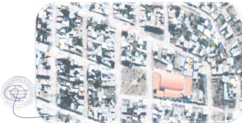
Imagen satelital de la ubicación del proyecto 1- ((I.E.I N° 432 - 33 - Florida)