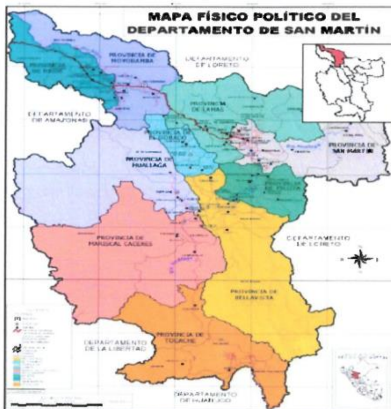
Mapa N°01: Ubicación de la provincia de Moyobamba

Departamento : San Martín Provincia : Moyobamba Distrito : Moyobamba Sector : Pabloyacu