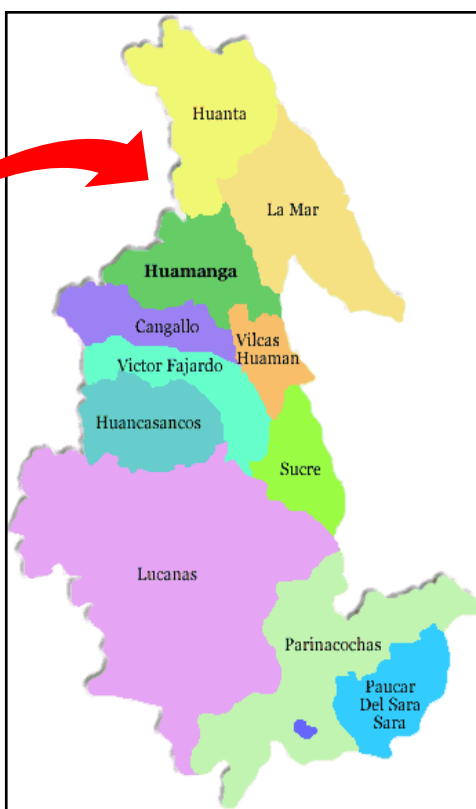
MAPA N° 03