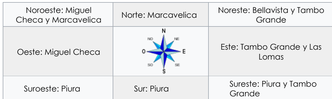
IMAGEN N° 01: MAPA MACRO LOCALIZACIÓN DEL PROYECTO

Por el Norte : Con el Distrito de Marcavelica. Por el Este : Con los Distritos de Tambogrande y Las lomas. Por el Sur : Con la Provincia de Piura. Por el Oeste : Con el Distrito de Miguel Checa.