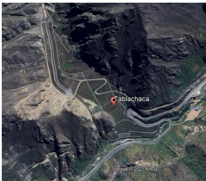
Imagen N 02 Foto satelital del depósito remediado Tablachaca