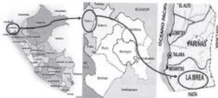
GRAFICO Nº01: MAPA DE UBICACIÓN PROVINCIAL