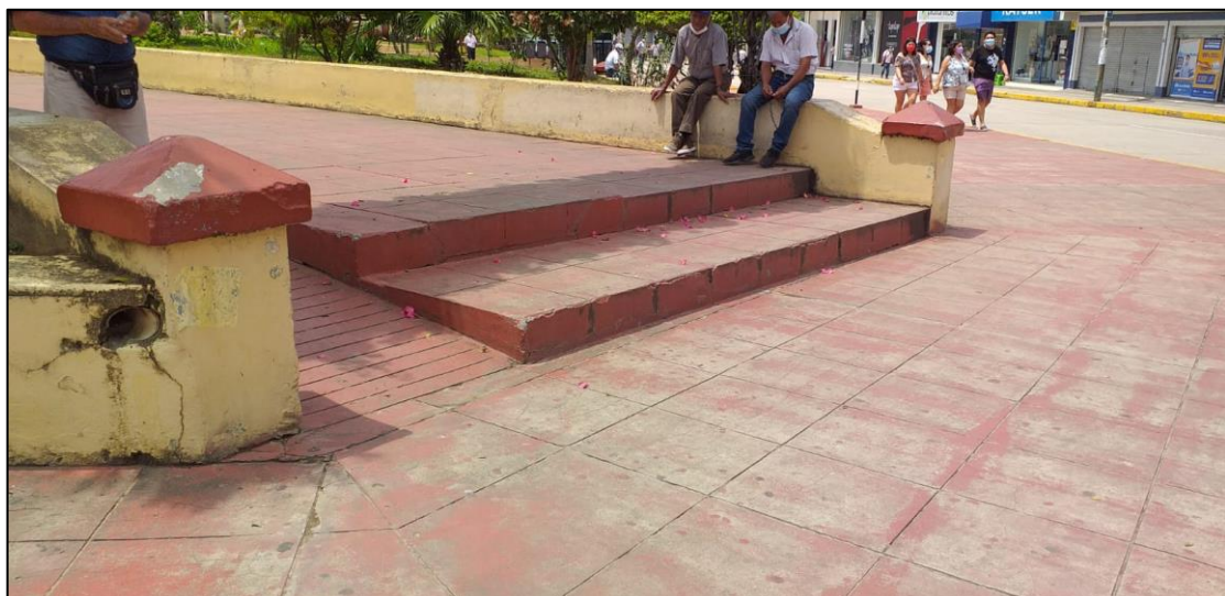
Imagen N° 7. Vista de lo deteriorado

Se tiene agrietamientos en los pisos como en los sardineles que circulan las áreas verdes y que funcionan como bancas, hundimientos en algunas zonas de la Plaza que se viene arreglando para evitar cualquier accidente.