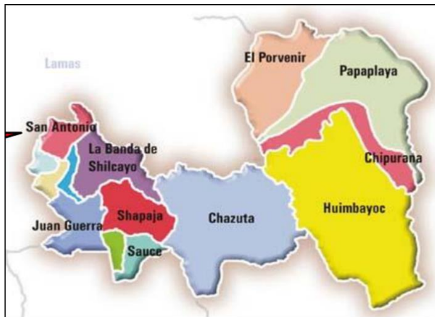
Imagen N° 02: Mapa del distrito de Tarapoto