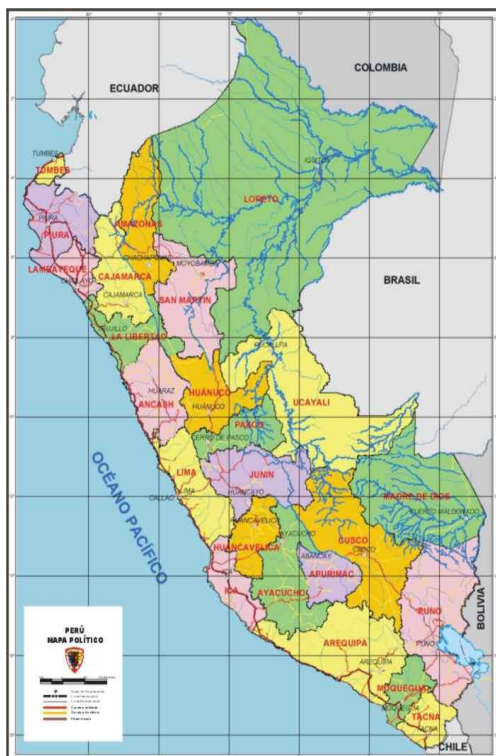
GRAFICO N°01 MAPA DE PERÚ