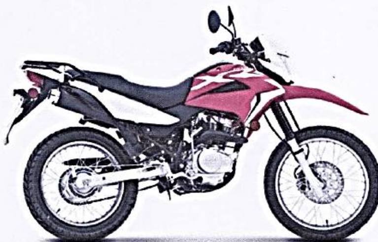
IMAGEN REFERENCIAL DEL MODELO TODO TERRENO