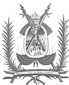
MUNICIPALIDAD DISTRITAL DE CERRO COLORADO FIGURA 01. ESCUDO MDCC.