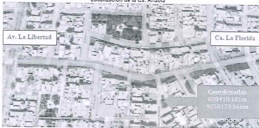
Localización de la Ca. Arizola

Distrito : Chiclayo Provincia : Chiclayo Región : Lambayeque