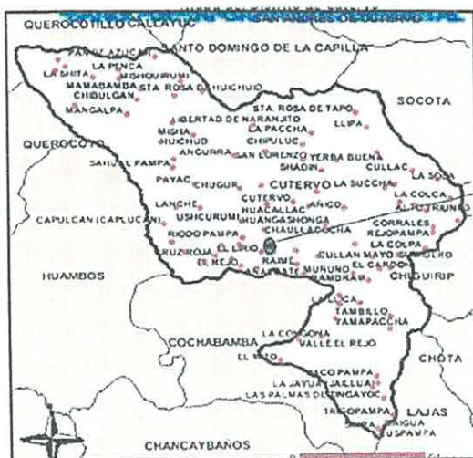
Imagen Nº 07 : Mapa del Distrito de Cutervo