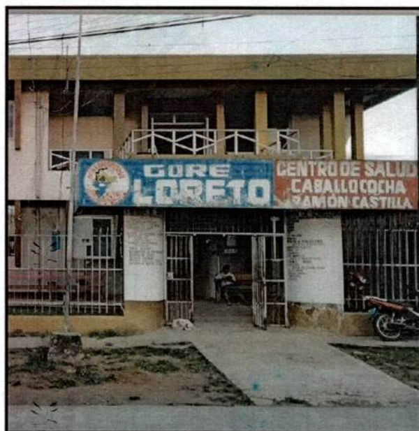
Vista 01 / Centro de Salud I-4 de la Localidad de Caballococha. Calle Bolognesi Cuadra 2 S/N..

El proyecto de inversión a nivel del Expediente Técnico a ser formulado a Nivel de Estudio Definitivo se ha denominado como: "CONSULTORÍA DE OBRA PARA LA ELABORACIÓN DEL EXPEDIENTE TÉCNICO DE OBRA Y EQUIPAMIENTO DEL PROYECTO DE INVERSIÓN DENOMINADO "MEJORAMIENTO DE LA PRESTACIÓN DE LOS SERVICIOS DE SALUD EN EL CENTRO DE SALUD I-4 CABALLOCOCHA, DISTRITO DE RAMON CASTILLA - PROVINCIA DE MARISCAL RAMON CASTILLA - DEPARTAMENTO DE LORETO".