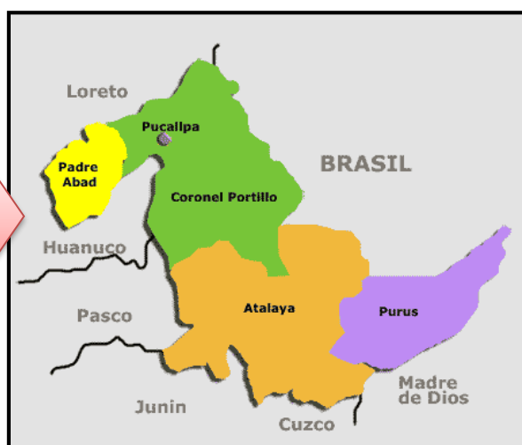
Mapa macro localización del departamento de Ucayali