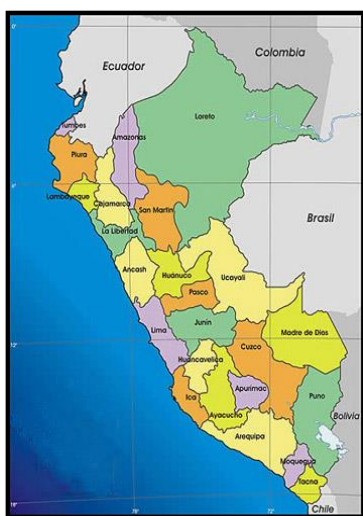
Mapa de macro localización del Perú

La zona de intervención del proyecto está ubicada en la parte sur Oeste de la ciudad de Pucallpa, perteneciendo a la zona urbana de la ciudad.