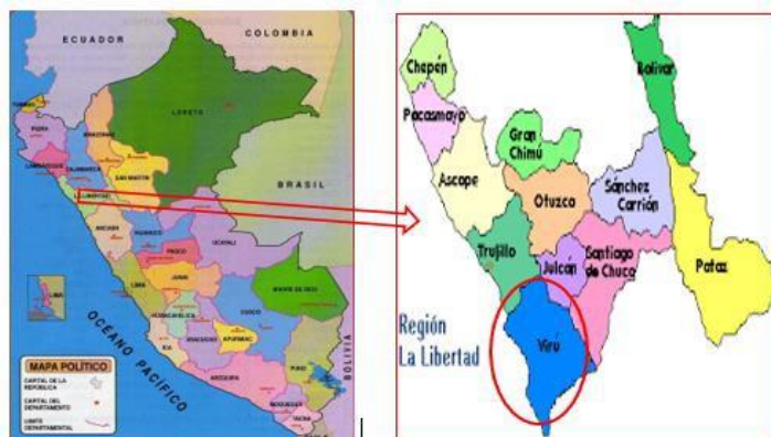
Ilustración 1: Macro-Localización del PIP.

Sector : Watanabe –Alto California Distrito : Viru Provincia : Viru Departamento : La Libertad