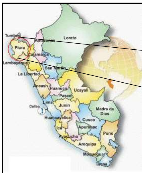
MAPA POLITICO DEL PERU