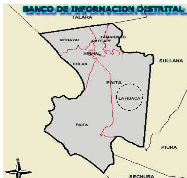
MAPA POLITICO DEL DISTRITO DE LA HUACA