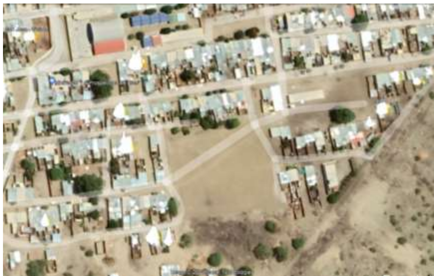
UBICACION DE SALON DE USOS MULTIPLES