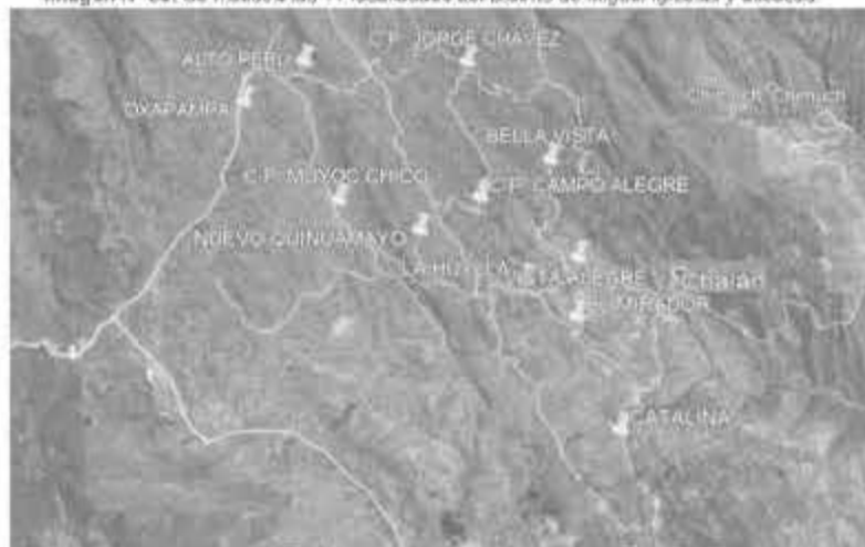
Imagen N° 03: Se muestra las 11 localidades del Distrito de Miguel Iglesias y accesos

"Año de la Lucha contra la Corrupción y la Impunidad"