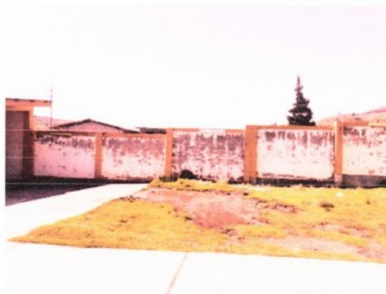
Foto 02. Se observa pintura exterior en mal estado