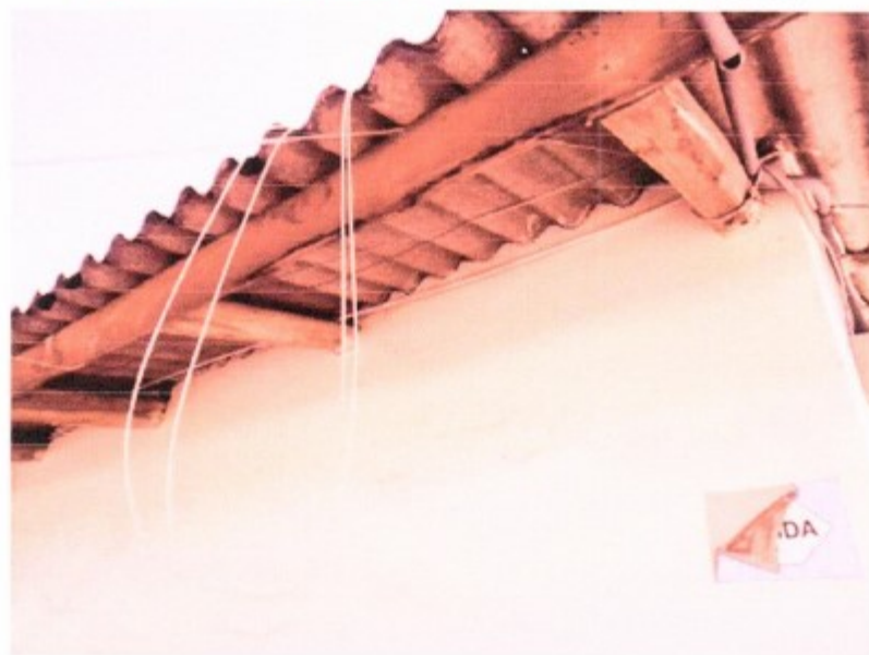
Foto 04. Se observa estructura del techo en mal estado