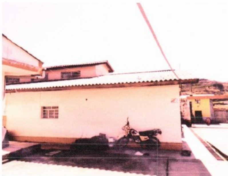
Foto 03. Se observa cobertura existente en mal estado