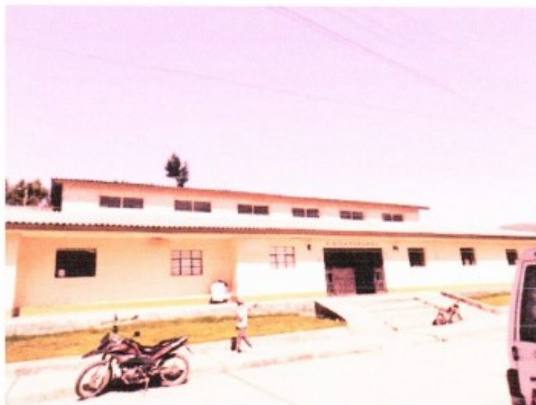
Foto 01. Frontis del Puesto de Salud

COORDINADOR GENERAL DE OPERACIONES DE LA RED DE SALUD JULCAN [Firma]