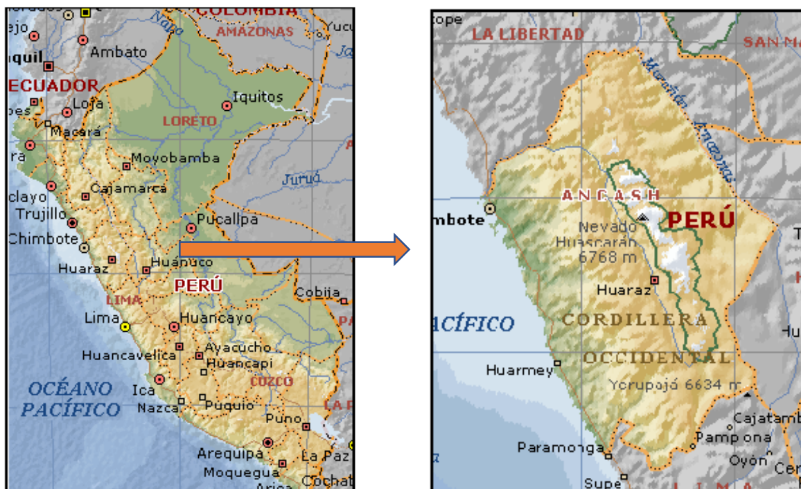
Fig. N° 02: Plano de Localización - Distrito de Nuevo Chimbote