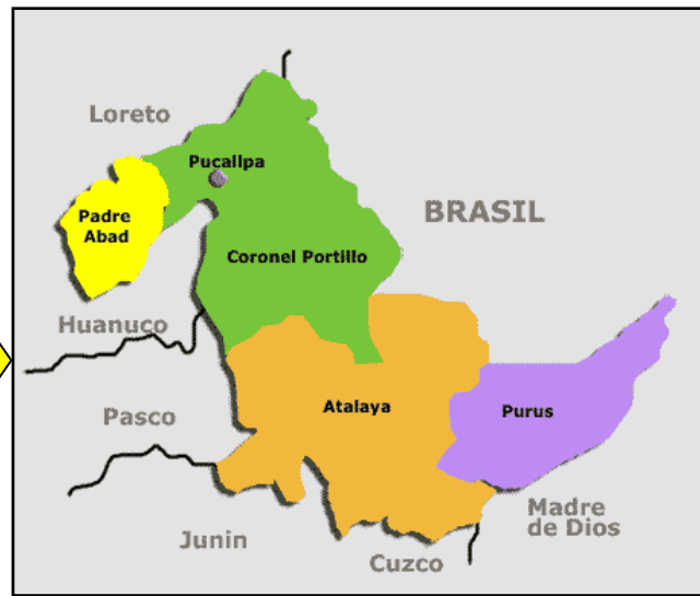
Mapa macro localización del departamento de Ucayali