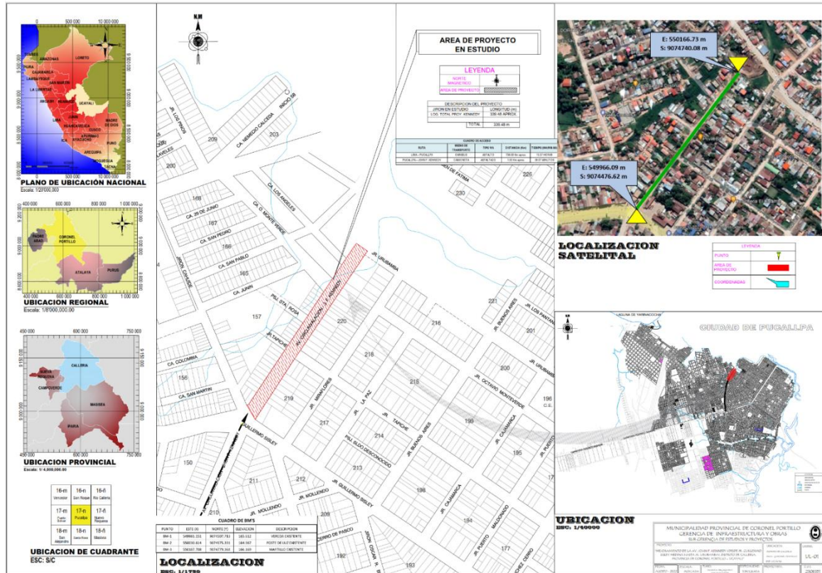
Fig. N°01 Ubicación Av. John F. Kennedy (Jr. Guillermo Sisley ∩ Jr. Urubamba).

3.1.3 ENTIDAD EJECUTORA “MUNICIPALIDAD PROVINCIAL DE CORONEL PORTILLO” A través de la Gerencia de Infraestructura y Obras.