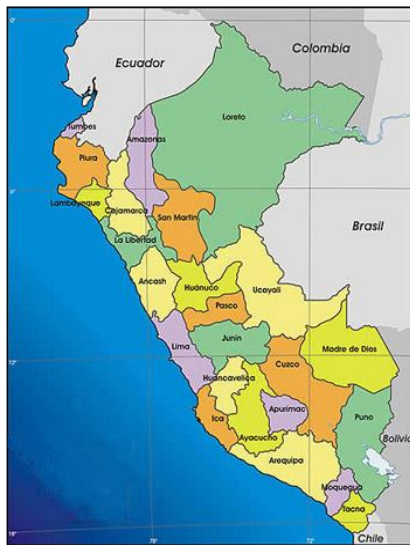
Mapa de macro localización del Perú