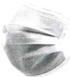
Fig. 1 (No incluye diseño)