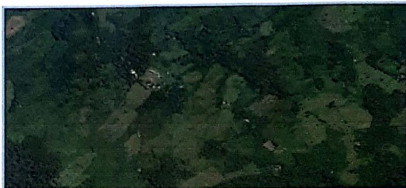
Imagen N°04: Micro localización – Localidad de SAN MARTIN DE PORRAS