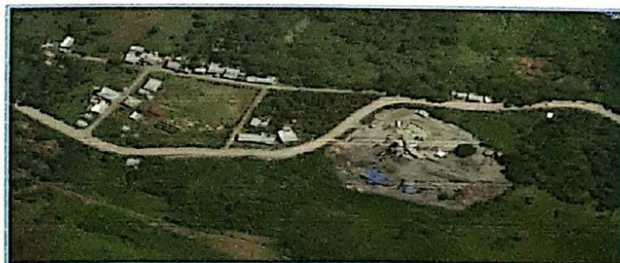
Imagen N°03: Micro localización – Localidad de HIDRONPAMPA