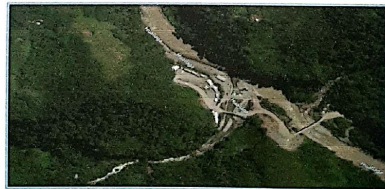
Imagen N°06: Micro localización – Localidad de MALLGO TINGO