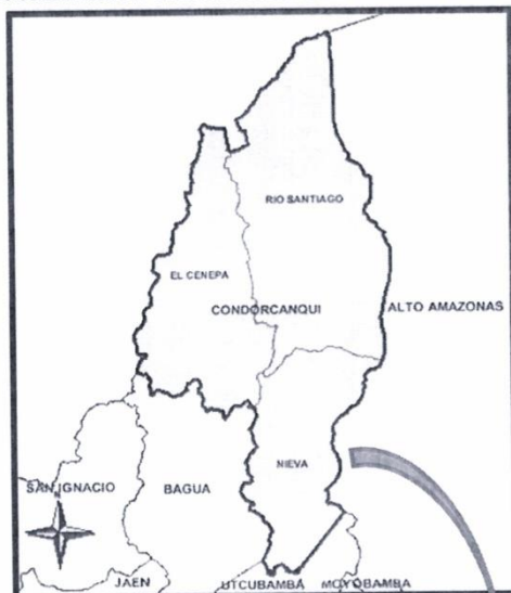
GRAFICO N° 02 LOCALIZACIÓN GEOGRÁFICA DEL DISTRITO RIO SANTIAGO