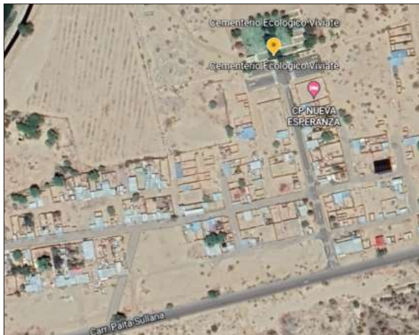
UBICACION DEL CEMENTERIO ECOLOGICO SAN JOSE