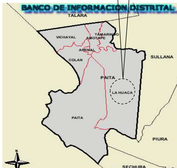
MAPA POLITICO DEL DISTRITO DE LA HUACA