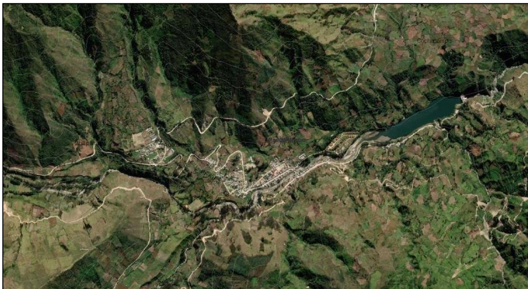
Area de estudio: Centro poblado de Huallamayo