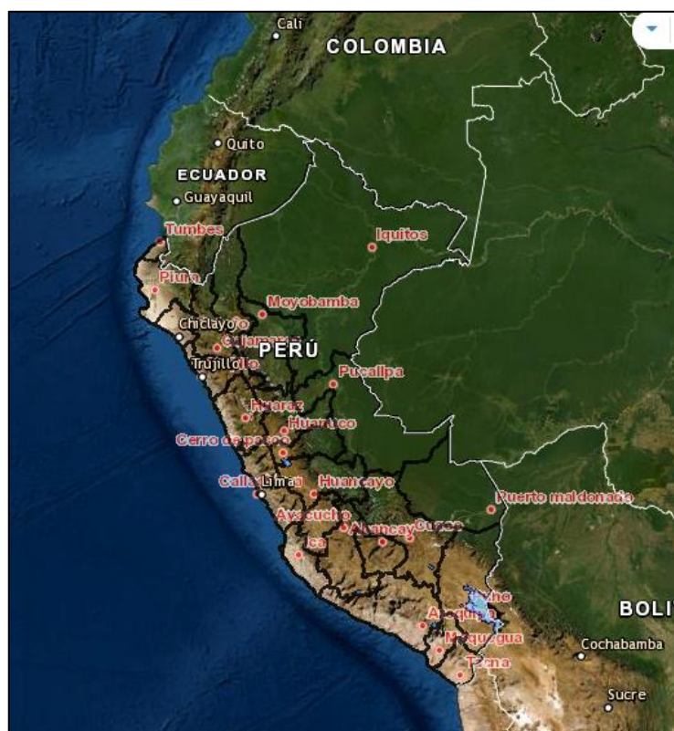
Mapa Nacional del Peru

Región : Pasco Provincia : Pasco Distrito : Paucartambo Localidad : Huallamayo