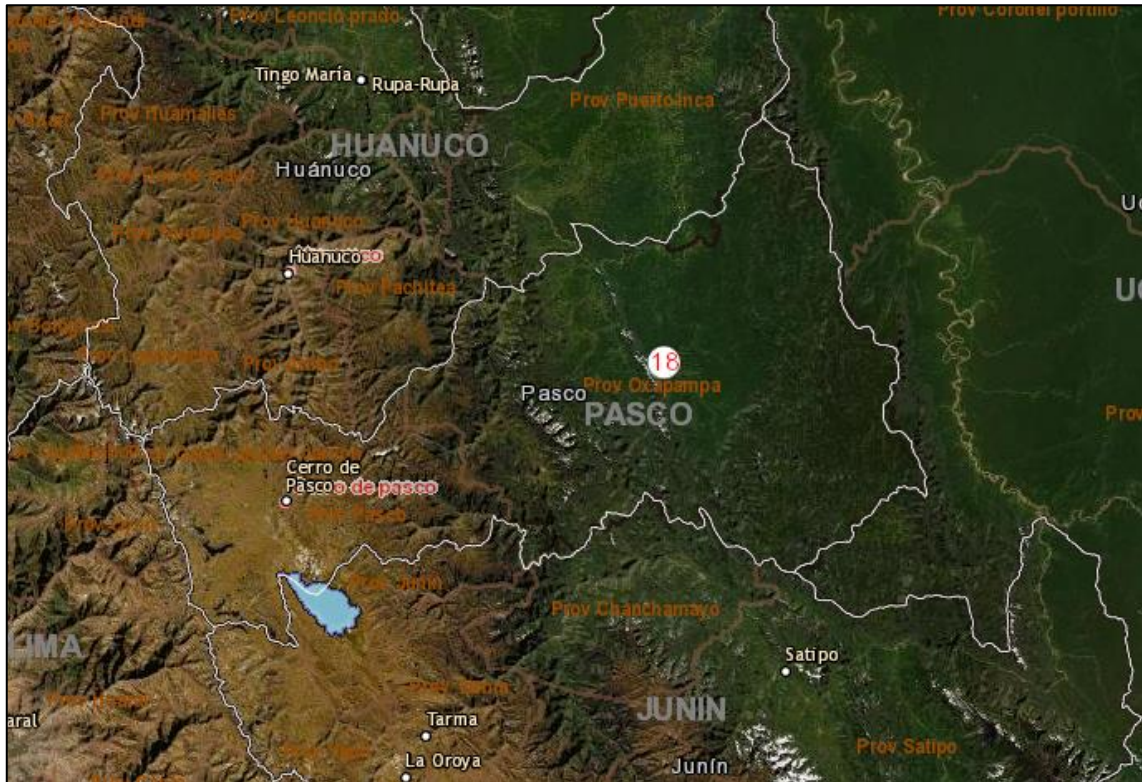
Mapa Departamental de Cerro de Pasco