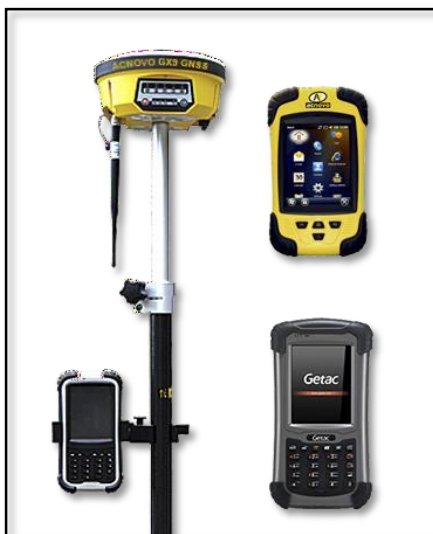
Figura 05: GPS Diferencial GX9.