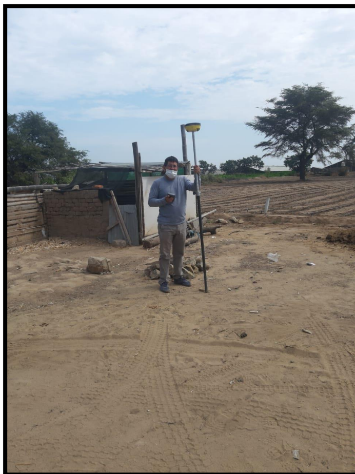
Figura 09: Toma de puntos de Unidades Básicas.