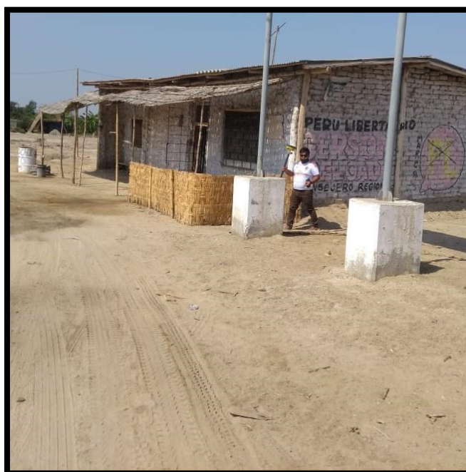
Figura 08: Lectura de puntos de lotes existente .