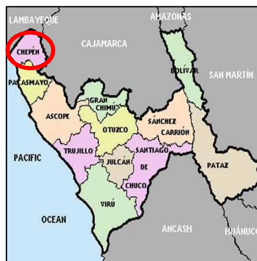
Figura 02: Mapa Provincial de La chepén.