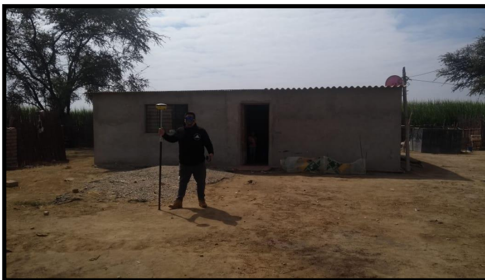
Figura 05: Área del Proyecto – Pueblo Nuevo – Chepén– La Libertad.