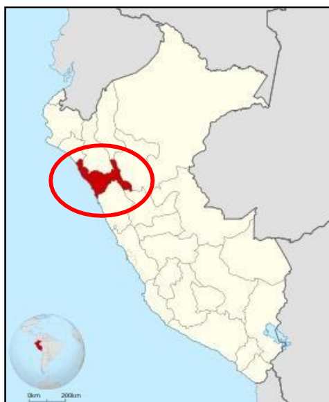
Figura 01: Mapa Departamental del Perú