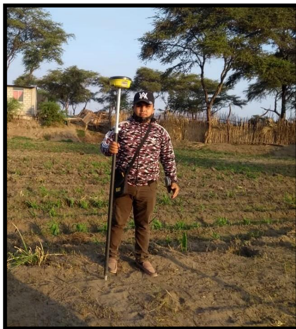
Figura 07: Colocación puntos de Unidades Básicas.