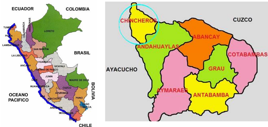
Imagen, Ubicación del Distrito de Anco Huallo:

Imagen, Ubicación del País y Departamento de Apurímac: