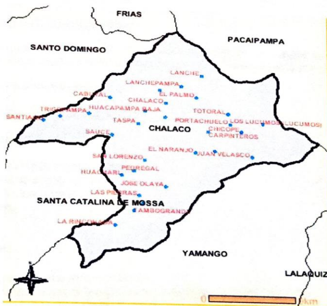
Fig. N° 01: DISTRITO DE CHALACO – CASERIO DE HUACAPAMPA