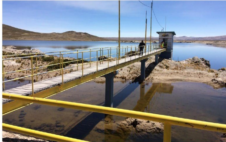
Foto1: Acceso a la caseta de la compuerta

de ésta compuerta es mediante eje que une la compuerta con el cilindro hidráulico de accionamiento, el movimiento se acciona mediante unidad hidráulica comandada eléctrica y manualmente, el acceso a la compuerta es mediante escalera vertical desde la caseta de la unidad hidráulica, el acceso a la caseta es mediante puente metálico con piso de madera.