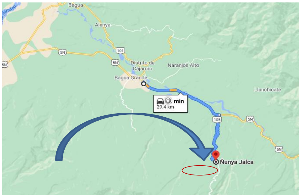
Imagen N° 2: Rutas de Bagua Grande a Ñunya Jalca