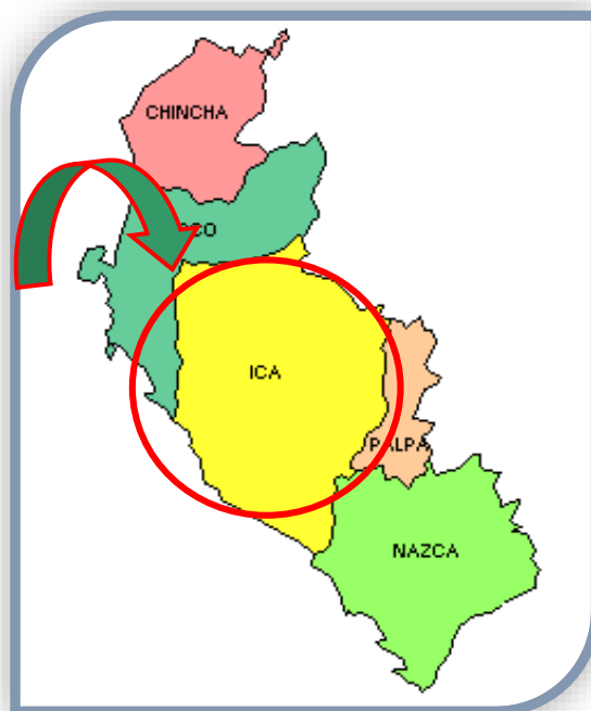
GRAFICO: 2.1.02