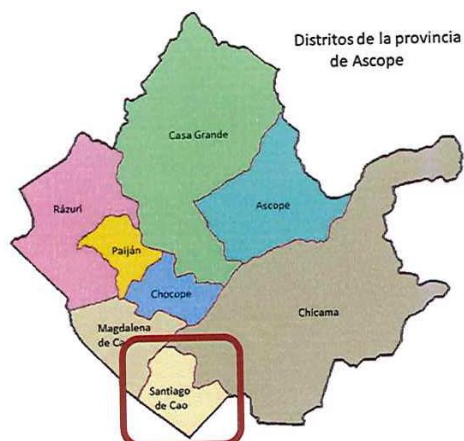
Figura N° 03: Ubicación del distrito de Santiago de Cao.

Centro Poblado : Cartavio Distrito : Santiago de Cao Provincia : Ascope Departamento : La Libertad