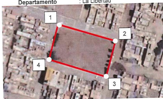
Figura N° 04: Ámbito de Influencia del Proyecto.

Centro Poblado : Cartavio Distrito : Santiago de Cao Provincia : Ascope Departamento : La Libertad