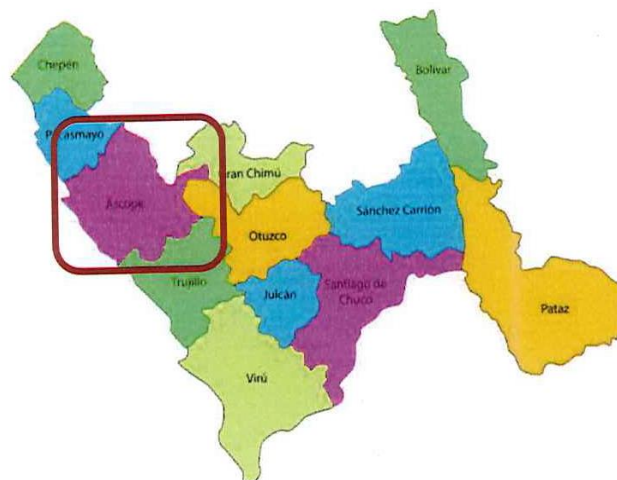
Figura N° 02: Ubicación de la provincia de Ascope.