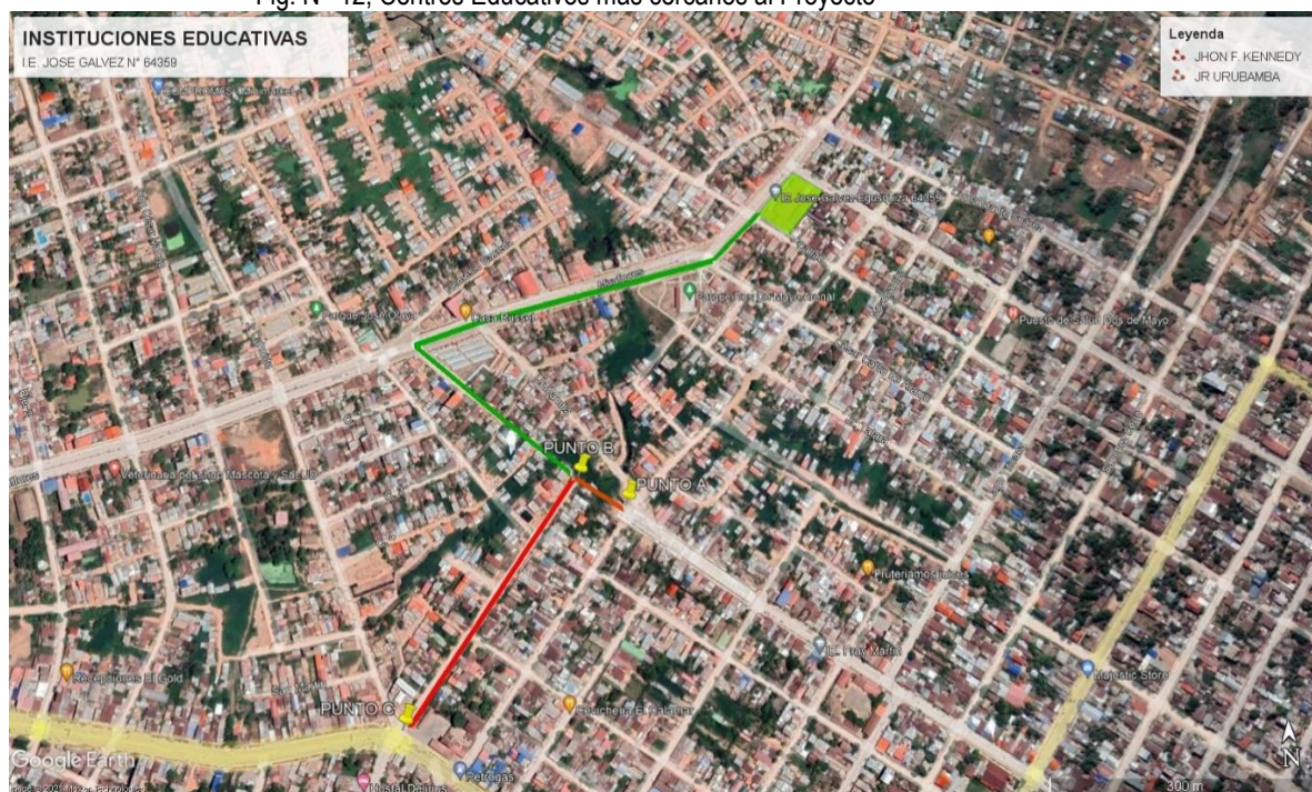
Fig. N° 12, Centros Educativos más cercanos al Proyecto

Por otra parte, se conoce la existencia de instituciones públicas, privadas y sociales, así como también, viviendas y negocios, que se encuentran cercanos al centro educativo, por ende, la existencia de población peatonal será mucho mayor. Cabe recalcar que dentro del área de influencia indirecta del proyecto se encuentran la I.E. José Gálvez N° 64359 que está ubicada a aproximadamente 800 metros del área de estudio.