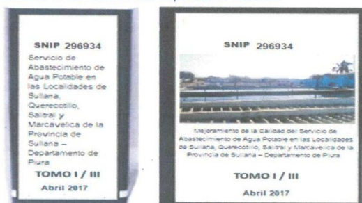
Ilustración 1: Modelo de Presentación del Expediente Técnico

A continuación, se describen los plazos estipulados para la prestación de los informes entregables, así como el plazo para levantamiento de observaciones.