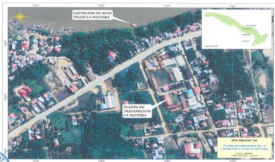
Plano 1: Ubicación del Ámbito de Intervención