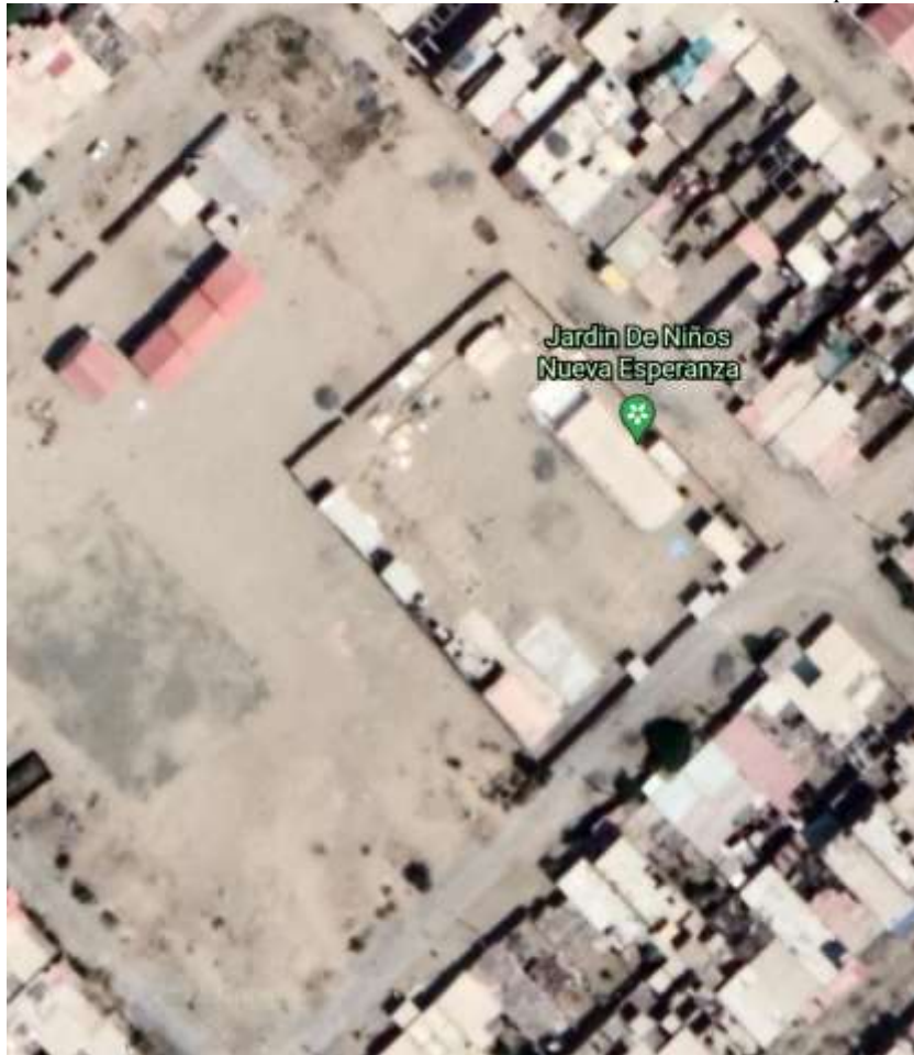
Grafico N° 01: Provincia de Santa, Distrito de Nuevo Chimbote, AA.HH. Nueva Esperanza Mz. I Lote 03

Región : Ancash Departamento : Ancash Provincia : Santa Distrito : Nuevo Chimbote