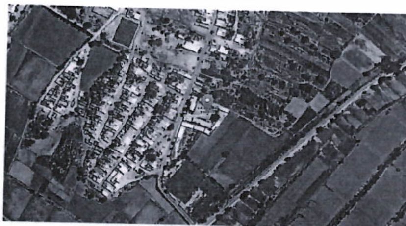
Ubicación de la I.E. Ricardo Palma

CR. CARRANZA DENTRO DE LA ZONA PROVINCIAL DE PROTECCIÓN