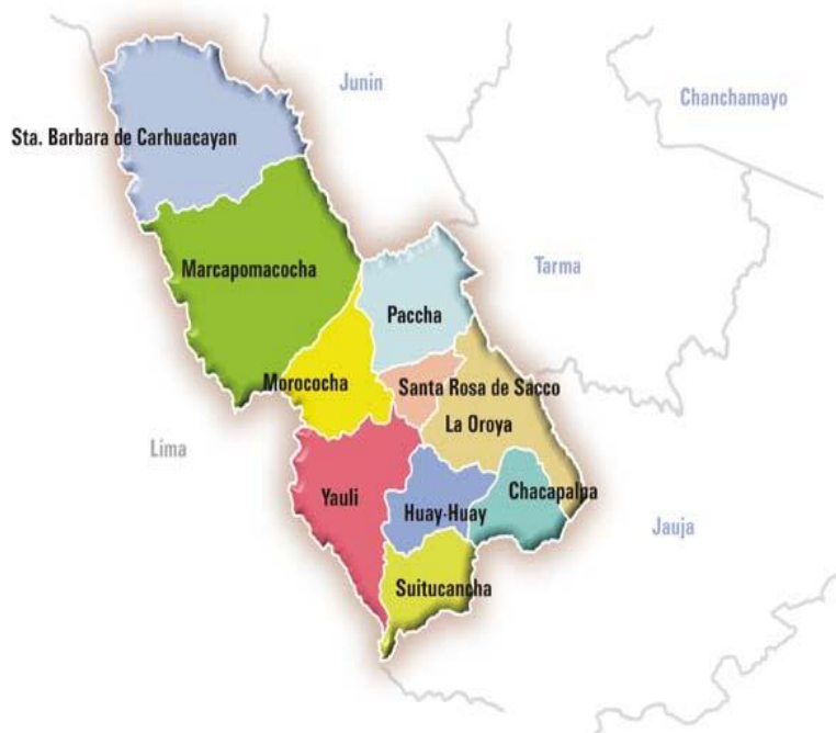
FIGURA 3: DISTRITO DE LA OROYA - YAULI