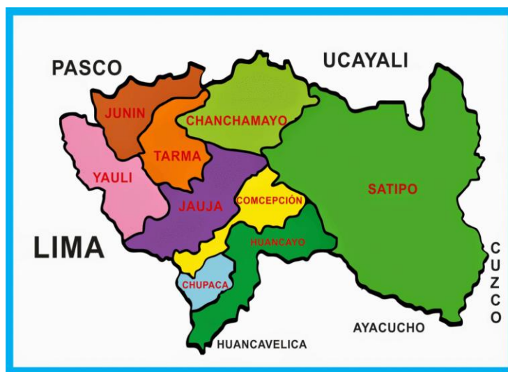
FIGURA 02: PROVINCIA DE YAULI