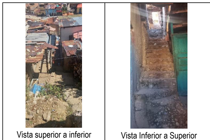
Vista superior a inferior

Se muestra las siguientes vistas fotográficas que evidencian la condición existente: